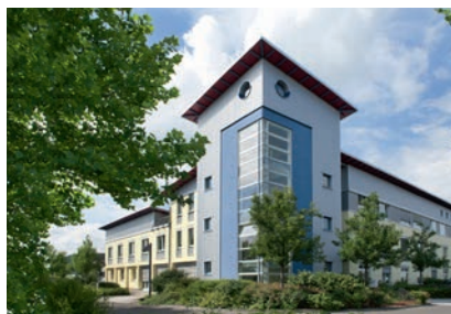
Vor Ort für Sie da: MainKinzigGas in der Rudolf-Diesel-Straße in Gelnhausen

Sie möchten uns persönlich und direkt vor Ort sprechen? Wir sind gerne für Sie da! Vereinbaren Sie einfach einen Termin mit unseren Ansprechpartnern (siehe rechts).