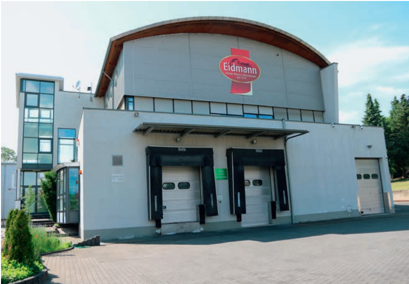
Auf dem Gelände der einstigen Blochmühle im Bruchköbeler Stadtteil Niederissigheim steht seit 1997 das moderne Produktions- und Verwaltungsgebäude der Firma Eidmann

Die Frankfurter Würstchen der Eidmanns sind nicht nur in Deutschland beliebt