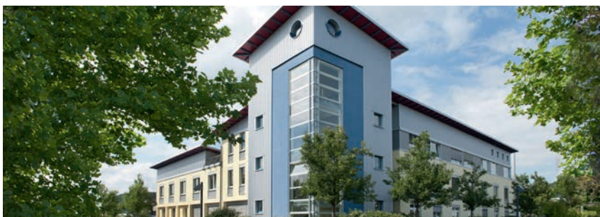
Vor Ort für Sie da: MainKinzigGas in der Rudolf-Diesel-Straße in Gelnhausen

Sie möchten uns persönlich und direkt vor Ort sprechen? Wir sind gerne für Sie da! Vereinbaren Sie einfach einen Termin mit unseren Ansprechpartnern (siehe rechts).