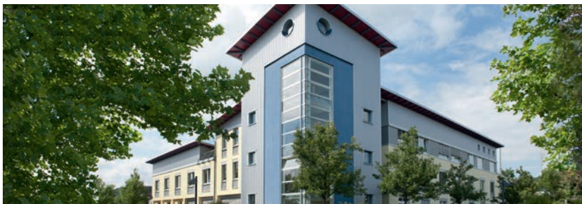
Vor Ort für Sie da: Die MainKinzigGas in der Rudolf-Diesel-Straße in Gelnhausen.