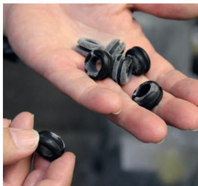
Jedes Teil ist Maßarbeit. Gerade die Automobilindustrie weiß die Qualität der Horst-Gummiwaren zu schätzen.

die Automobil- und Elektroindustrie. „Die qualitativen Anforderungen wachsen in diesen Bereichen ständig. So werden zum Beispiel Motoren immer leistungsfähiger. Unsere Kunden wissen, dass unsere individuell gefertigten Produkte diese Entwicklungen mitgehen“, so der Geschäftsführer.